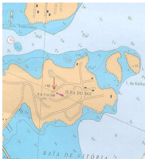
Vista aérea, carta, planta ou croqui:

OBS.: RA 0083/02. coordenadas reprocessadas pelo CHM.