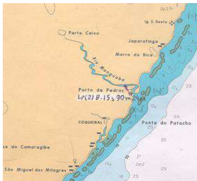
Vista aérea, carta, planta ou croqui:

Este Farol pertencia a C-900 cuja as coordenadas em Córrego Alegre eram Lat. 09° 09' 23",5070S e Long. 035° 17' 53",4280W, após ser cancelada, passou a pertencer a C-22200 e as coordenadas atuais estão em WGS-84.