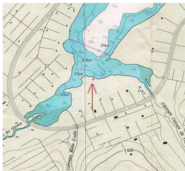
Vista aérea, carta, planta ou croqui:

Marco testemunho padrão DHN, cravado em pilar de concreto feito com tubo de PVC de 10 centímetros de diâmetro, aflorado 10 centímetros do solo, situado no tope de uma pequena elevação.