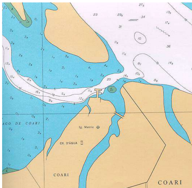
Vista aérea, carta, planta ou croqui:

A coordenada foi obtida com um giro no horizonte amarrando angularmente alguns pontos notáveis da cidade.