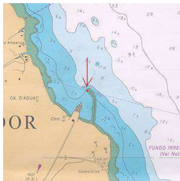
Vista aérea, carta, planta ou croqui:

Marco testemunho padrão DHN nº 07.765, encravado no quebra-mar de proteção ao Terminal da CNB em Bom Despacho, na Ilha de Itaparica, protegido por base de cimento circular. O ponto se encontra no final do molhe a 3 metros do poste e a 1 metro do letreiro. Neste molhe existe um outro ponto, QBM- Bom Despacho, que diferencia do molhe Bom Despacho por ser uma chapeleta de bronze e não um marco testemunho padrão DHN.