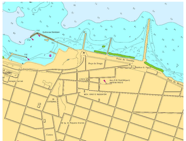
Vista aérea, carta, planta ou croqui:

Coordenadas transformadas de Córrego Alegre para WGS-84, através do programa Gpsurvey 2.35.