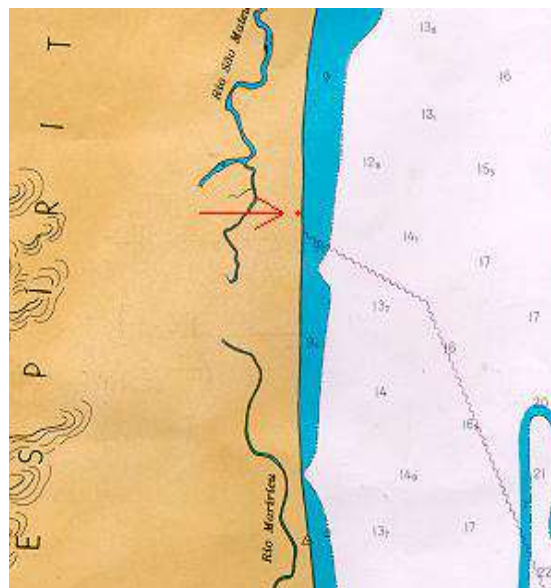
Vista aérea, carta, planta ou croqui:

O marco testemunho está localizado na parte superior da caixa d'água de Povoação (CAAE) ao lado de uma pequena igreja com o mesmo nome da localidade e na frente está um campo de futebol.