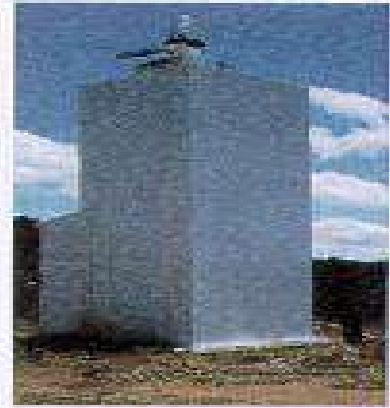
1696 ILHA DO FRADE