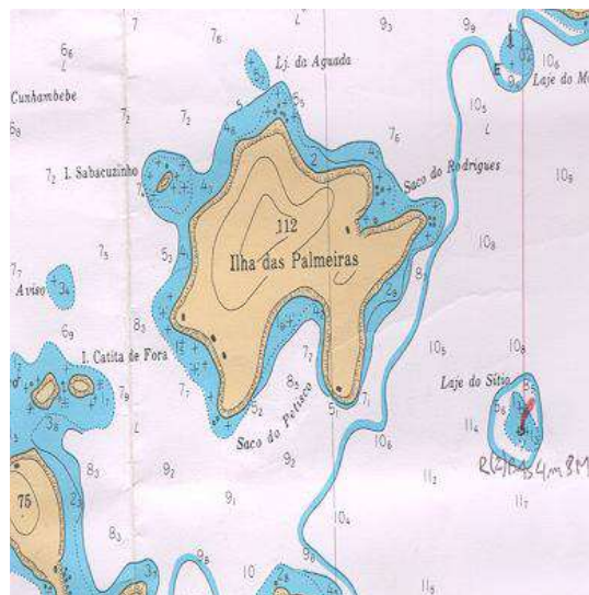
Vista aérea, carta, planta ou croqui:

O marco está colocado num tubo de PVC, no centro e na parte mais alta da laje mais externa. O desembarque poderá ser feito com facilidade pelo lado Leste da Ilha, junto a laje.