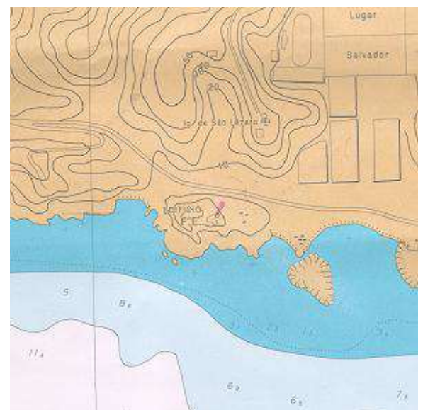
Vista aérea, carta, planta ou croqui: