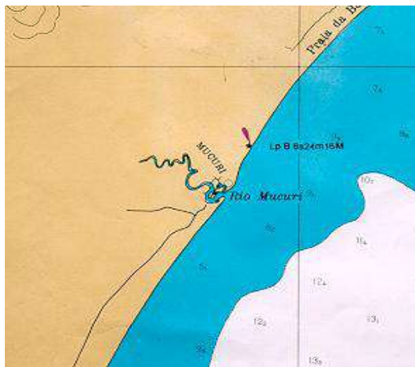
Vista aérea, carta, planta ou croqui:

Assim que sair da pista de asfalto que leva até Mucuri, pegar a esquerda e seguir em frente pela estrada de barro até que a concentração de casas do lado direito. Aí então, dobrar a primeira a direita e ir até a praia, onde dará de frente com uma barraca, entrar a esquerda e logo a uns 30 metros parar e caminhar para a esquerda que avistará o ponto.