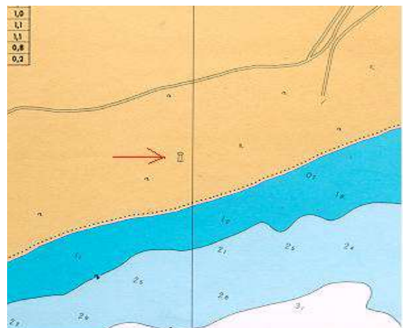
Vista aérea, carta, planta ou croqui: