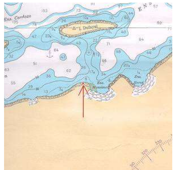
Vista aérea, carta, planta ou croqui:

Vindo da Enseada Martel, entrando na Enseada Ezcurra, encontra-se a Ilha Dufayel ao fundo, prosseguindo por bombordo passa-se pela Enseada Hervé onde há uma geleira, e pela Enseada Monsimet, onde se encontra uma segunda geleira. Nesta enseada há uma pequena restinga sedimentar. Ao desembarcar sobre ela, caminha-se em direção ao fundo de ezcurra e sobre a primeira pequena elevação na praia há uma pirâmide de pedras em torno do marco-testemunho. Obs: coordenadas transformadas do Datum WGS-72 para WGS-84.