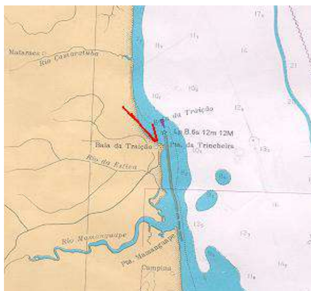
Vista aérea, carta, planta ou croqui:

A estação é o cruzeiro do alto da fachada da Igreja Nossa Senhora da Penha, na Baía da Traição.