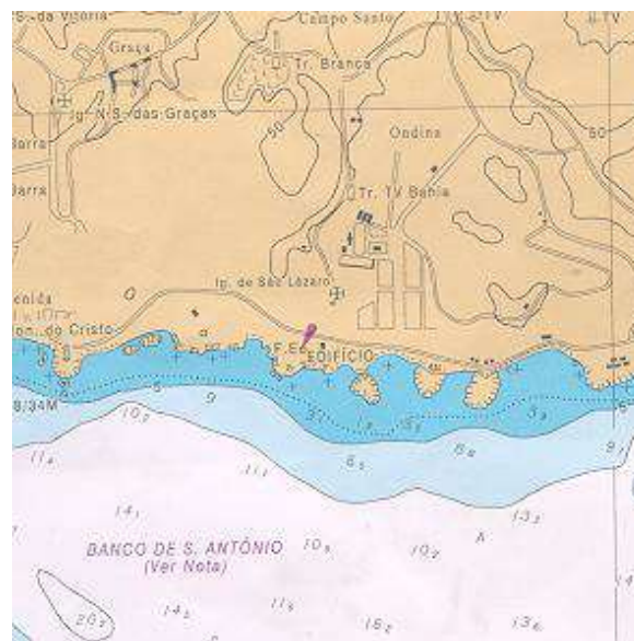
Vista aérea, carta, planta ou croqui:

A simples caminhada pelo telhado do prédio levará a localização do ponto.